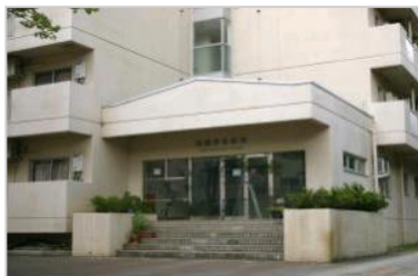
[国際学生宿舎 外観]

キッチン、ユニットバス、トイレ、給湯設備、冷暖房用空調設備、シングルベット2、片袖机、回転椅子、書棚、応接テーブル、応接イス、食卓テーブル、食卓イス、食器棚、整理ダンス、玄関収納庫、洗濯機、乾燥機、冷蔵庫、電気スタンド、クローク