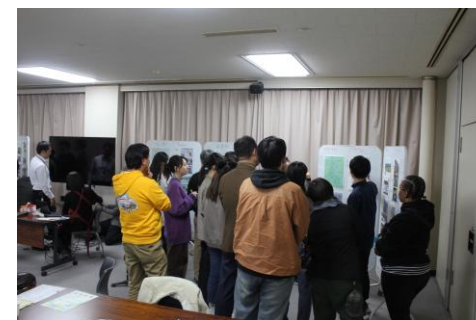
～ 留学生が語る／留学生と語る会 ～