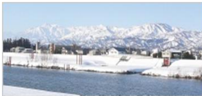
～ 冬景色の上越市 ～