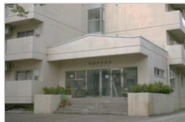
～ 国際学生宿舍 外観 ～

夫婦室（9,500円/月・共益費1,500円/月） キッチン、ユニットバス、トイレ、給湯設備、冷暖房用空調設備、シングルベット2、片袖机、回転椅子、書棚、応接テーブル、応接イス、食卓、テーブル、食卓イス、食器棚、整理ダンス、玄関収納庫、洗濯機、乾燥機、冷蔵庫、電気スタンド、クローク