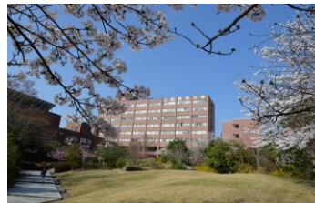
～ 正面から見た上越教育大学 ～