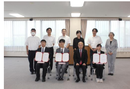
～ 短期留学生修了証書授与式 ～

修了生に対し、本学が毎月配信している「国際交流ひろば」や「留学生ネットワーク」をととして情報提供を配信しています。