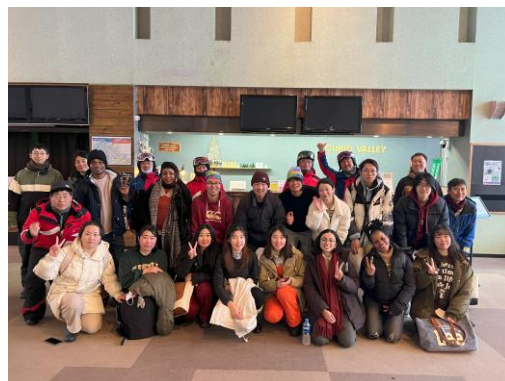
～ 雪国スキー体験 ～