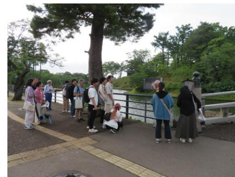
～ 上越地域の歴史・文化等に触れる町歩き ～