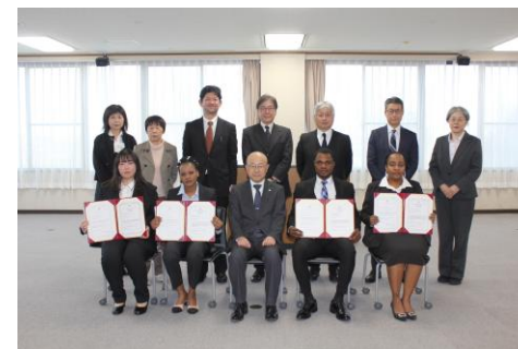
～ 教員研修留学生修了証書授与式 ～

指導教員によって異なりますが、概ね週1回程度の指導教員による論文指導・週4科目程度の講義（日本語補講を含む）・週2日程度の学校現場での演習を行うこととしています。また修了時には、受入教員と日本語教員の指導のもとで進めた一年間の研究成果を発表し、修了レポート（概ね30ページ程度）を提出します。