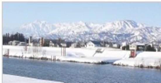
～ 冬景色の上越市 ～