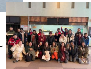
～ 雪国スキー体験 ～