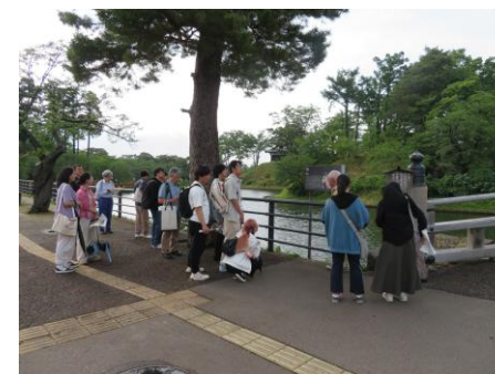
～上越の歴史・文化研修～