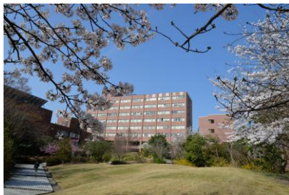
～ 正面から見た上越教育大学 ～

大学がある上越市は、歴史的文化財が豊富であると同時に自然環境にも恵まれ、雪国を代表する都市として有名です。東京からは、北陸新幹線を用いて約2時間で来ることができます。