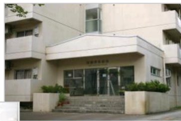
～ 国際学生宿舎 外観 ～