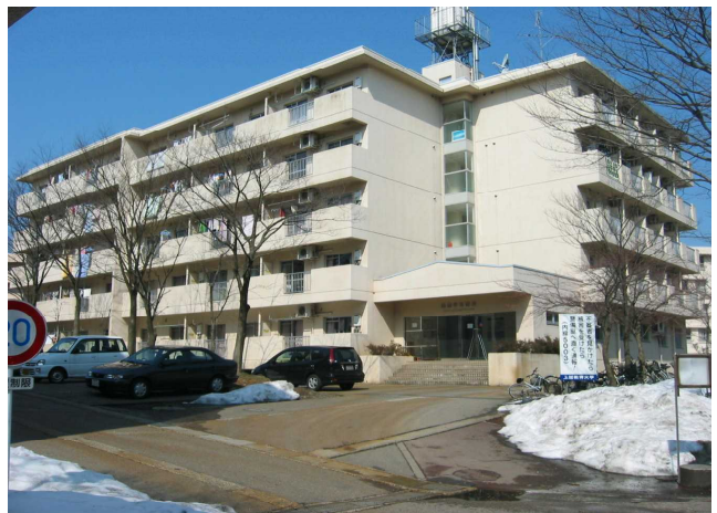
国 際 学 生 宿 舎 International House