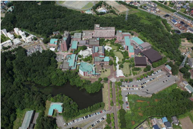
全 景 View