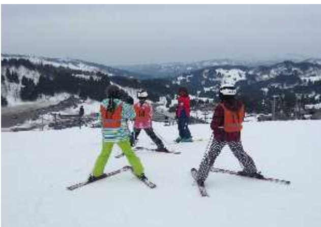
スキーのつどい Ski Trip