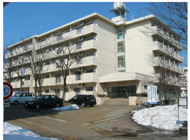
国際学生宿舎 International House