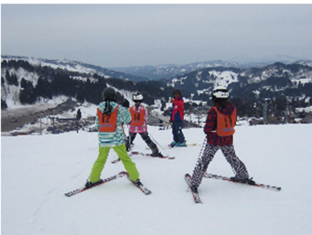
スキーのつどい Ski Trip