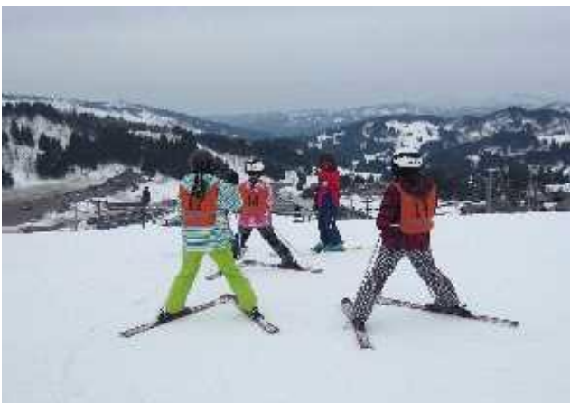
スキーのつどい 滑雪旅游