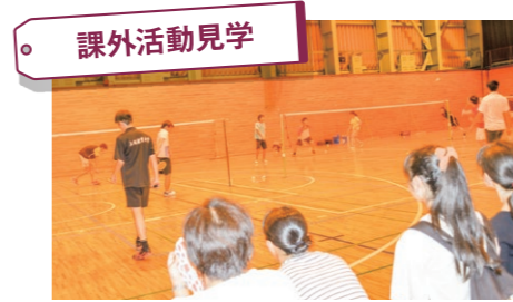
課外活動見学 課外活動団体の練習や発表の様子を見学しよう。