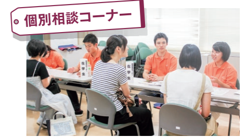
個別相談コーナー 在学生とスタッフがお答えします。キャンパスライフや入試、授業のことなどなんでも聞いてみよう。