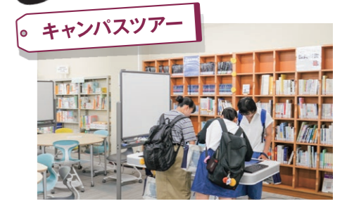
キャンパスツアー 在学生がキャンパスを案内します。講義室、図書館など大学の施設を見学しよう。