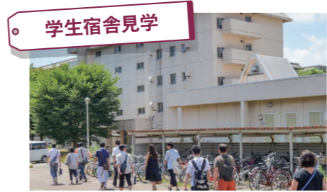
学生宿舎見学 キャンパス内に設置されている学生宿舎を見学しよう。