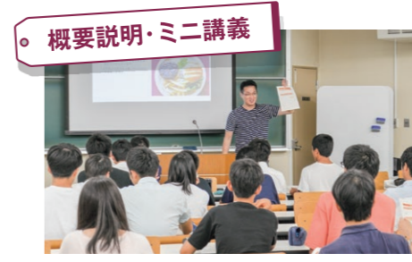
概要説明・ミニ講義 大学概要の説明とミニ講義を実施します。大学の先生の授業を体験しよう。講堂では概要説明動画を視聴できます。