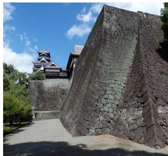
(藤井一幸 [5] 32 ページより)